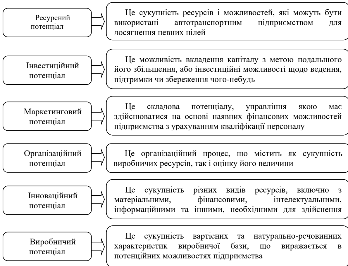
Рис. 1. Основні підходи щодо визначення понять потенціалу підприємства [9]

Методика оцінки конкурентоспроможності потенціалу «Гексоген потенціалу» використовує аналіз шести ключових аспектів автотранспортного підприємства. Ці аспекти враховуються при визначенні рівня конкурентоспроможності і можливостей оптимізації потенціалу у стратегії адаптивної реструктуризації. Основні аспекти, які враховуються в методиці «Гексоген потенціалу», містять: