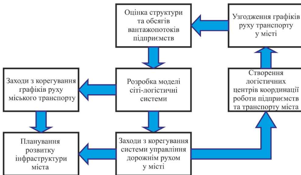
Рис. 2. Структура управління сіті-логістичною системою

регулярність руху транспортних засобів громадського користування, прогнозованість термінів доставки вантажів у межах міста, швидкість сполучення на маршрутах громадського транспорту та розрахункову швидкість руху, що застосовується для визначення кількості та типів транспортних засобів для доставки вантажу та при плануванні маршрутів руху.